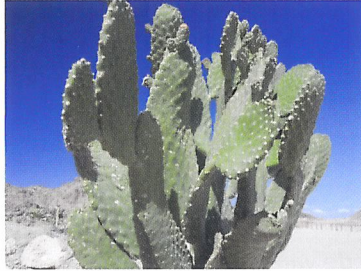
Afb. 1.80 Een cactus groeit in een woestijn. Als kamerplant kan een cactus op een warme plek in de zon staan. Een cactus heeft weinig water nodig.

Sommige planten hebben een speciale verzorging nodig. Vaak heeft een plant een klein verzorgingskaartje. Hierop staat informatie over de verzorging. Op internet is ook van alles te vinden over de verzorging.