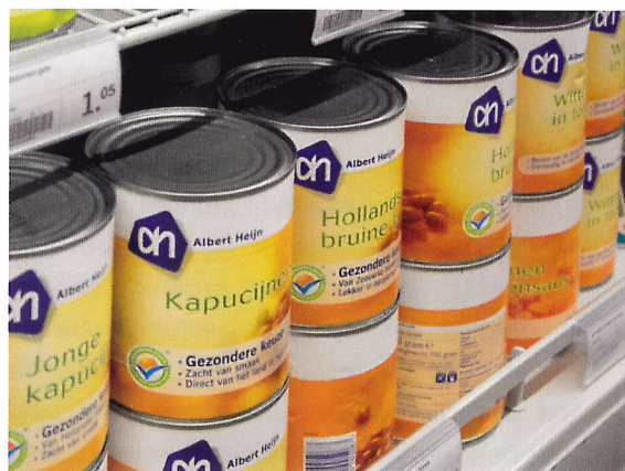
Afb. 1.78 Producten in blik zijn lang houdbaar.

wanneer een winkel iets uit de schappen haalt, verschilt per winkel. De bakker verkoopt bijvoorbeeld zijn brood niet meer als het een dag oud is, terwijl de supermarkt het brood dan misschien afprijst en wel verkoopt.