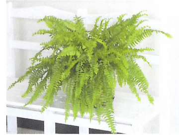
Afb. 1.82 Een varen groeit onder andere in tropische bossen in de schaduw. In huis heeft een varen weinig licht nodig, maar wel veel water.

1.39 Wat zijn basisregels voor de verzorging van een bloeiende plant?