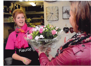
Afb. 1.85 Als verkoper geef je de klant advies over de verzorging van een boeket.

1.40 Wat doe je wel en wat doe je niet met snijbloemen die in de winkel staan?