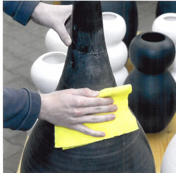
Afb. 1.79 Het schoonmaken van een vaas

Producten die in de winkel staan, moeten schoon zijn. Dat geldt ook voor de schappen of tafels waar ze op staan, en ook voor de vloer. Om schoon te maken, moet je soms producten opzij zetten, bijvoorbeeld om de vloer te vegen en/of te dweilen. Kijk uit met het gebruik van water. Sommige producten kunnen hier niet tegen. Een schone, droge doek om af te stoffen kun je altijd gebruiken. Bij het terugzetten van producten is het van belang dat zowel het product als de ondergrond droog is.