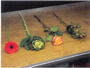
Afb. 1.83 Voorbeelden van snijbloemen: gerbera, sierkool, roos en hertshooi.