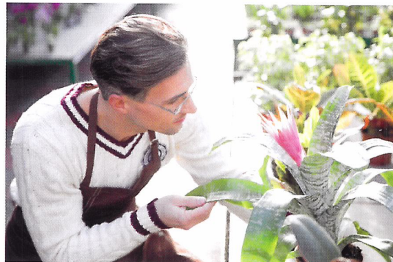
Afb. 1.77 Kamerplanten hebben verzorging nodig als ze in de verkoopp ruimte staan.

Veel producten die in de winkel staan, hebben verzorging nodig totdat ze verkocht worden. Denk maar aan levende producten als dieren, bloemen en planten. Maar ook niet-levende producten hebben verzorging nodig. Want producten met een laag stof erop worden niet snel verkocht. Natuurlijk kun je niet van alle producten precies weten hoe je ze verzorgt. Maar bijvoorbeeld voor bloemen en planten zijn er enkele basisregels.