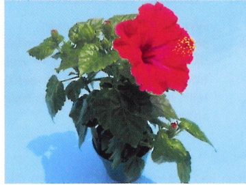
Afb. 1.81 Een hibiscus is een bloeiende plant. Een bloeiende plant heeft veel water en licht nodig. Bloeiende planten mogen niet te warm staan, dus niet boven de verwarming of in de zon.